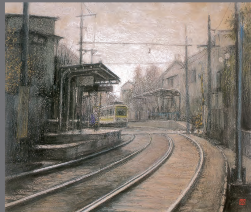
小池俊夫画 「雑司ヶ谷停留所（都電 荒川線）」パステル 450x525mm

25年ほど前に描かれた都電雑司ヶ谷の停留所です。都電の愛称は「さくらトラム」となりましたが、停留所のホームも屋根もほとんど変わっていません。しかしまわりの風景は大きく変わろうとしています。都電沿線で進められている都市計画道路によって木造建物のすぐ近くを都電が走るという、雑司が谷の原風景の一つがなくなりつつあります。